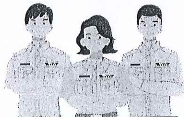
หลักสูตร Smart City (หลักสูตรต่อยอด)

การบริหารจัดการโครงการ Smart City ระบบข้อมูลเมือง City Data Platform การจัดซื้อจัดจ้าง